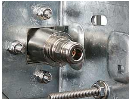
Antena zakończona gniazdem N